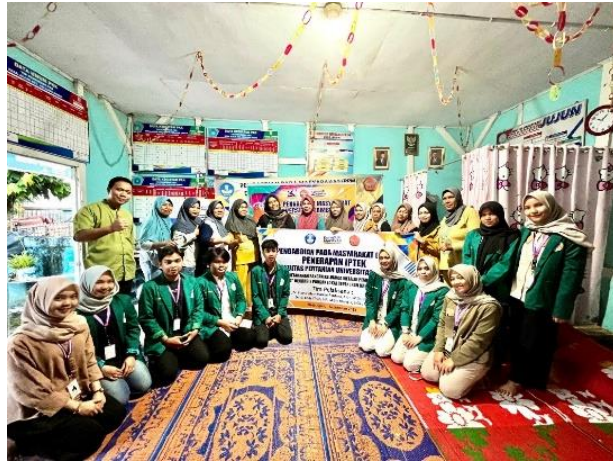
Gambar 3. Tim pengabdian masyarakat bersama mitra sasaran