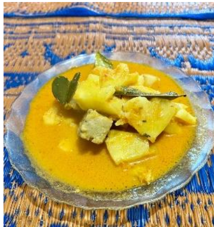
Gambar 2. Hasil olahan tepek ikan danau

Kegiatan demonstrasi pembuatan olahan tepek ikan sebagai menu khas Jambi menggunakan ikan danau, yaitu nila dan seluang diikuti dengan antusias oleh sasaran. Mitra sasaran dalam hal ini BUMDES dan TP-PKK Desa Jujun sangat tertarik mengikuti kegiatan pengabdian masyarakat yang diberikan. Kegiatan pengabdian masyarakat sangat relevan dengan kebutuhan masyarakat mengingat selama ini perekonomian masyarakat Desa Jujun sangat bergantung kepada hasil perkebunan sayuran dan buah. Belum terdapat masyarakat yang membuat dan memasarkan olahan ikan danau menggunakan menu makanan tradisional. Peningkatan ketahanan pangan rumah tangga dan peningkatan wisata kuliner Desa Jujun secara langsung maupun tidak langsung akan berdampak pada meningkatnya pengetahuan dan kemahiran masyarakat dalam mengolah ikan danau.